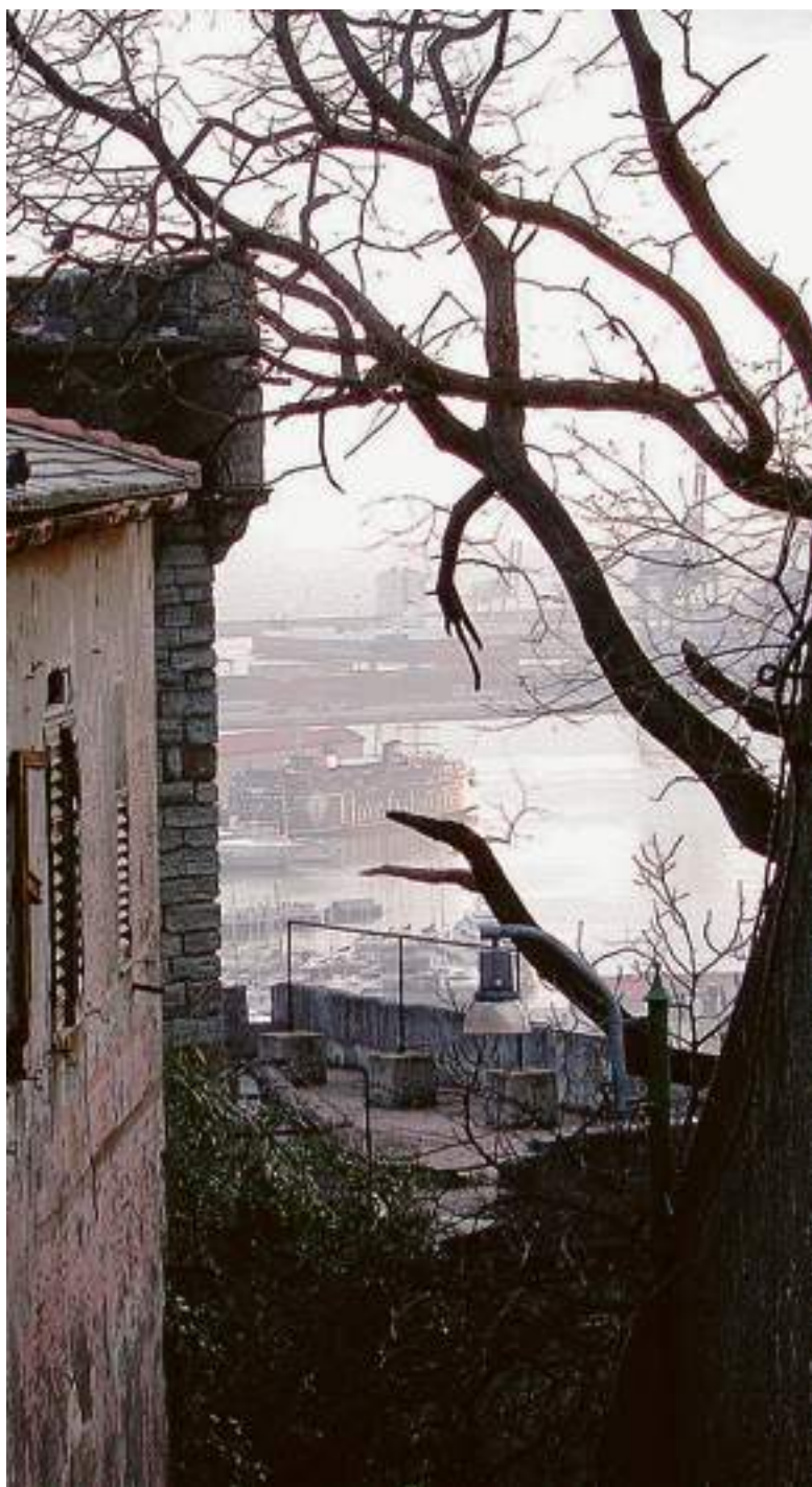
Creuze di Castelletto: la veduta da salita San Simone verso il porto