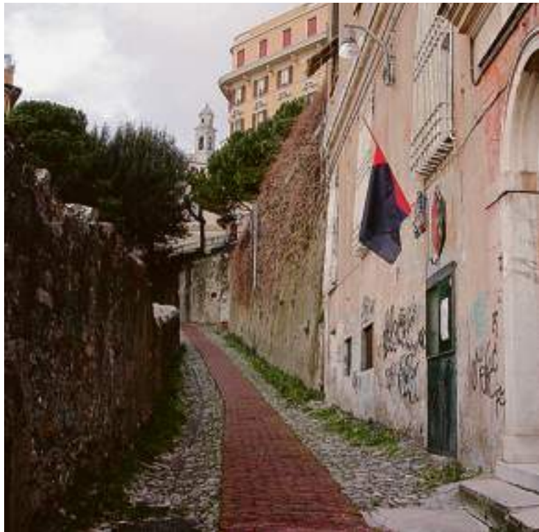
Salita San Nicolò riaperta, dopo che per anni è stata intransitabile

E nozioni storico-artistiche che diventano una bussola per andare su e giù per il quartiere e scoprire i deliziosi villini ottocenteschi di via Privata Piaggio, i complessi religiosi medievali e barocchi come San Barnaba, San Nicola da Tolentino e la Madonnetta, le ville patrizie d'origine cinquecentesca come Villa Piaggio e Villa Rovereto e la villa