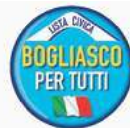
Bogliasco, il simbolo del centrodestra

A Propata la lista "Per Propata - Comunisti Alta Val Trebbia" è stata costretta a separare il simbolo della falce e martello: non più incrociati, come appare nel simbolo della Federazione delle sinistre, ma divisi: martello a sinistra, falce a destra, collocati sotto una stella, tutto di colore rosso. Lo stesso problema era stato rilevato dalla commissione circondariale di controllo sui simboli un anno fa, quando la lista comunista si era presentata alle elezioni di Torrighia.